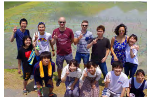
田んぼアートのお手伝い