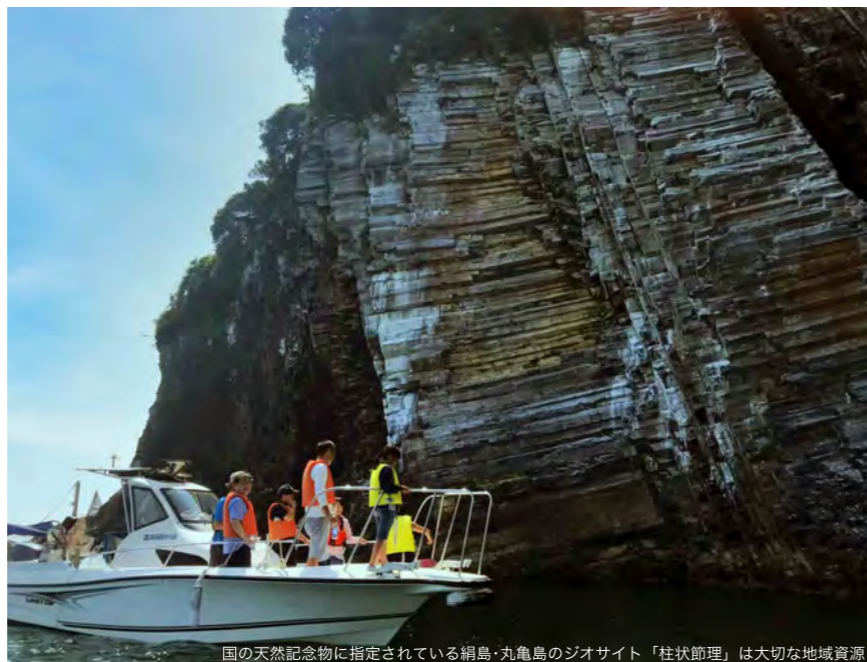
国の天然記念物に指定されている網島・丸亀島のジオサイト「柱状節理」は大切な地域資源