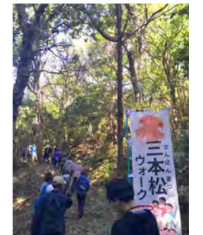
まちあるきイベント