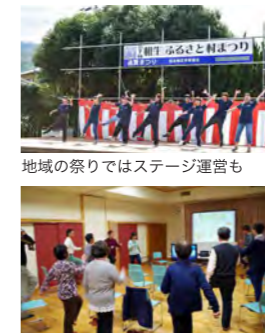
地域の祭りではステージ運営も