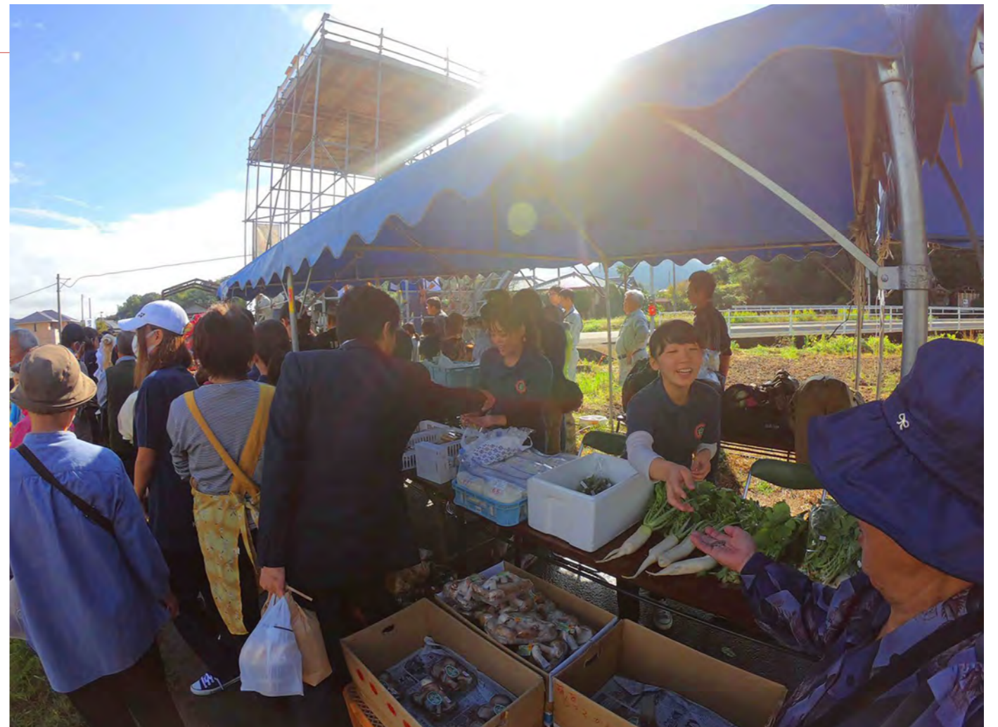
マルシェ / 農業の六次産業化のお手伝い