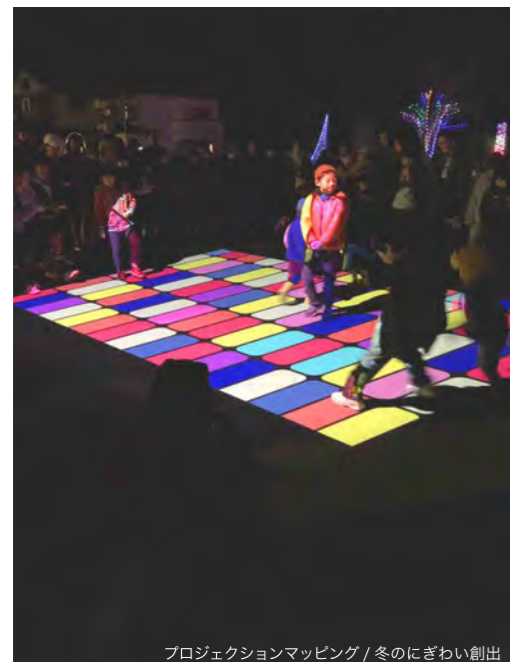
プロジェクトマッピング / 冬のぎわい創出