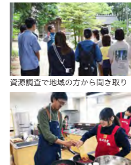
資源調査で地域の方から聞き取り